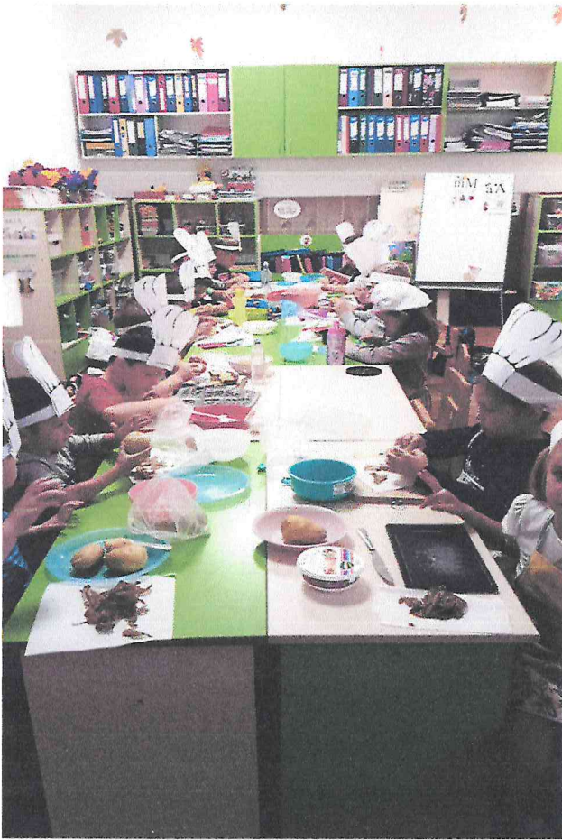
„ALIMENTAȚIE SĂNĂTOASĂ ȘI STIL DE VIAȚĂ SĂNĂTOS”