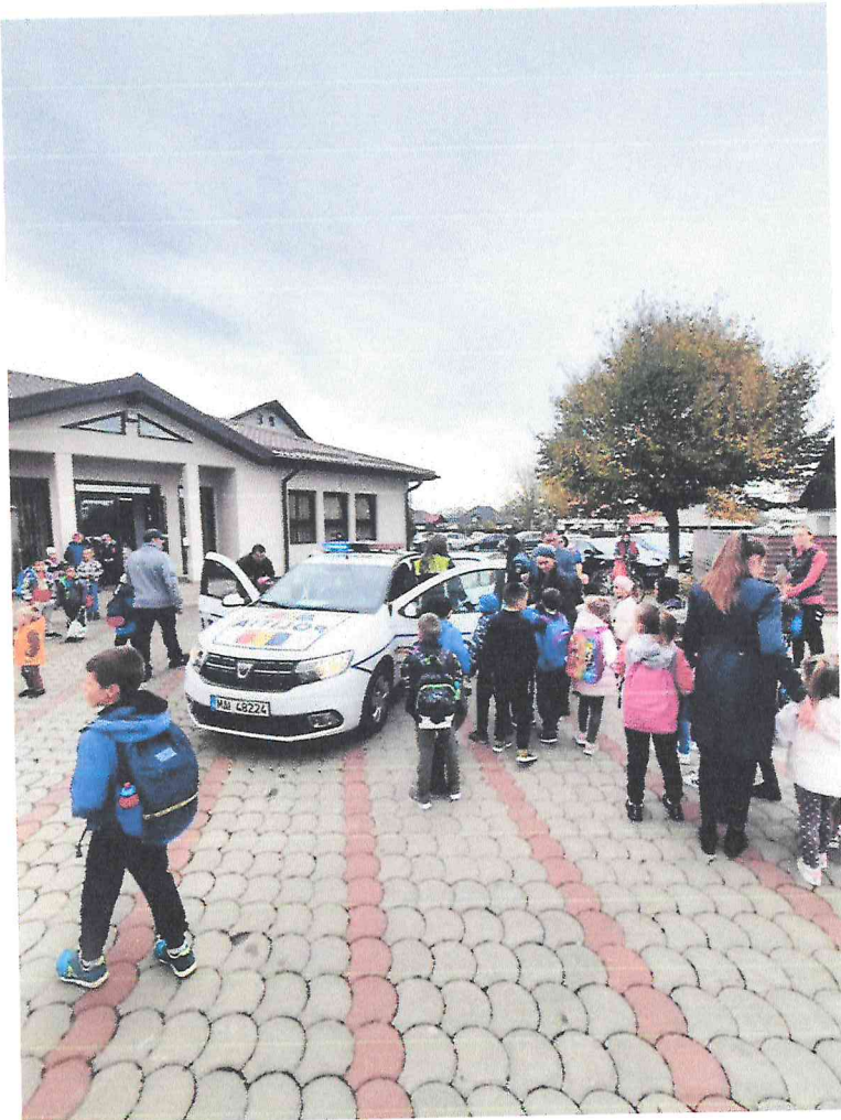
„Copilarie în siguranță”